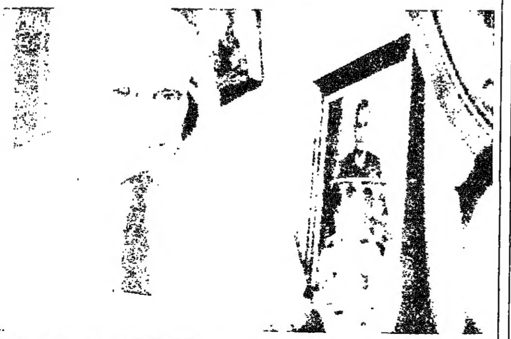
الكاتبة اريك نايف (٩٠ عاما)، فكاك الشفرة السابق، يجلس حزينا امام الكاميرا بعد ان علم بان كتابا يدور حول مذكراته خلال الحرب، جرى سحبه من الاسواق على اثر اعتراضات الحكومة البريطانية لندن - ر